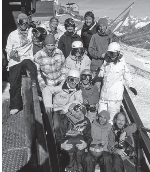
Einige junge Snowboard Experten waren erstmals am Zentralkurs dabei und konnten sich überzeugen, dass auch die alten Hasen noch einige Tricks auf Lager haben.