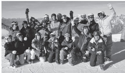
Zwar wenig Schnee aber tolles Wetter auf dem Klein-Matthorn und ein lehrreiches Programm trugen zu einer Topstimmung bei den Ski-Experten des Kantons Luzern bei.

Das kantonale Luzerner Expertenteam kann jetzt somit bestens vorbereitet die neue Wintersaison in Angriff nehmen. Einmal mehr überzeugte der hohe fachliche und methodische Level dieser Kurse die Teilnehmenden.